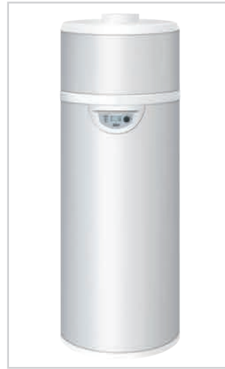
EDEL AIR modèle mural