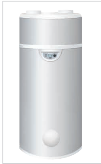
EDEL AIR modèle au sol