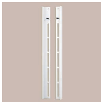
Étriers de transfert