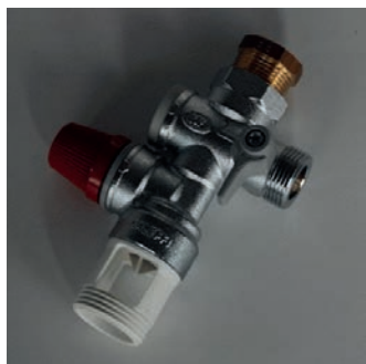
Groupe de sécurité 3/4" + 1/2"